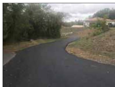
◆ Chemin de Labro