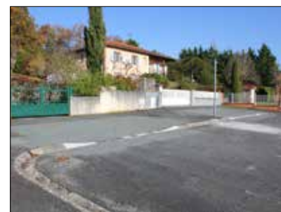
◆ Rue des Mésanges