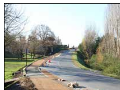
◆ Cheminement doux avenue Pascal