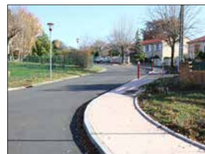
◆ Rue Corneille