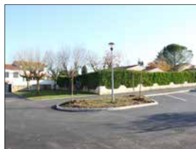
◆ Rue des Bruyères