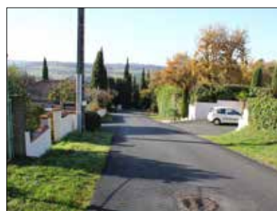
◆ Rue des Pinsons