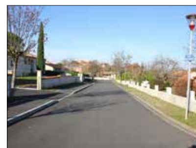
◆ Rue Molière