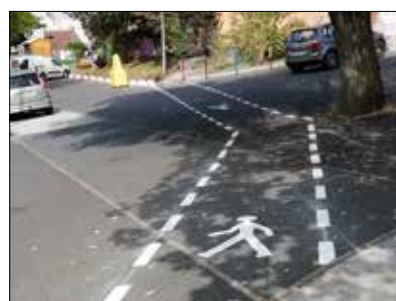
◆ Cheminements devant les écoles