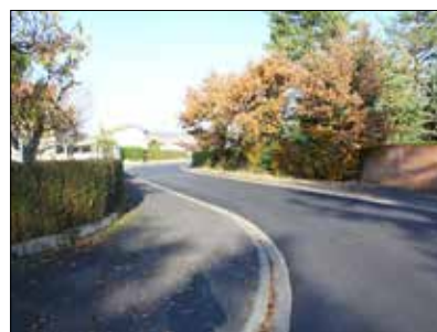
◆ Rue Al Cause