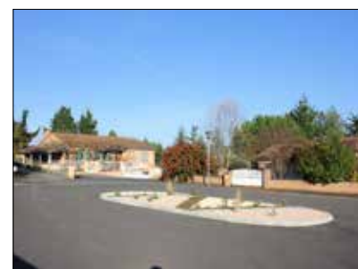
◆ Placette rue Raymond IV